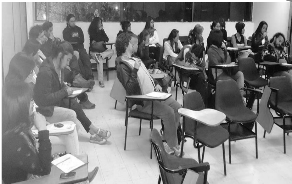
Homenaje a la Asociación Dimensión Educativa

Finalmente, el compañero Paulo presenta algunas reflexiones a manera de conclusión con las que pretende señalar algunos interrogantes y apuestas de las educadoras populares, entre ellas está la idea fuerza de desarrollar espacios de formación que le permitan a estas nuevas generaciones de educadoras populares, ser la dimensión educativa de los procesos de transformación social que tanto necesita el país.