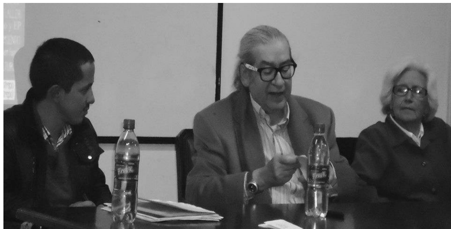
En 1982 salió a la luz pública el primer número de la Revista