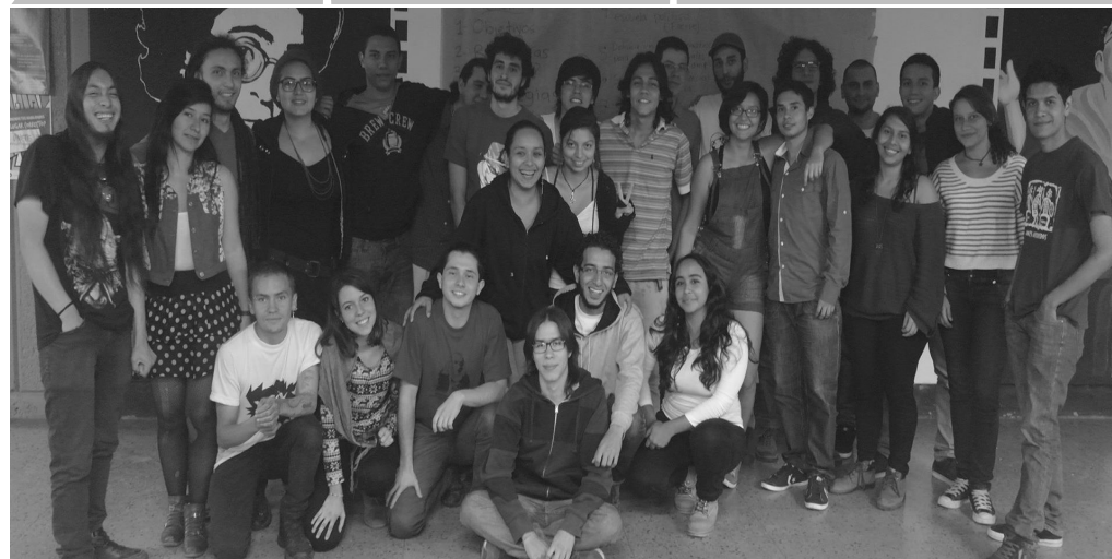
Primer Encuentro de Pre Universitarios Populares de Medellín y áreas cercanas. Nov. 2014

La construcción de una articulación nacional de educación popular es una de las apuestas que nos hemos trazado como Coordinadora. Dicha apuesta solo será posible si continuamos con el ejercicio de entablar diálogos y compartir experiencias con los procesos de educación popular que existen a nivel nacional.