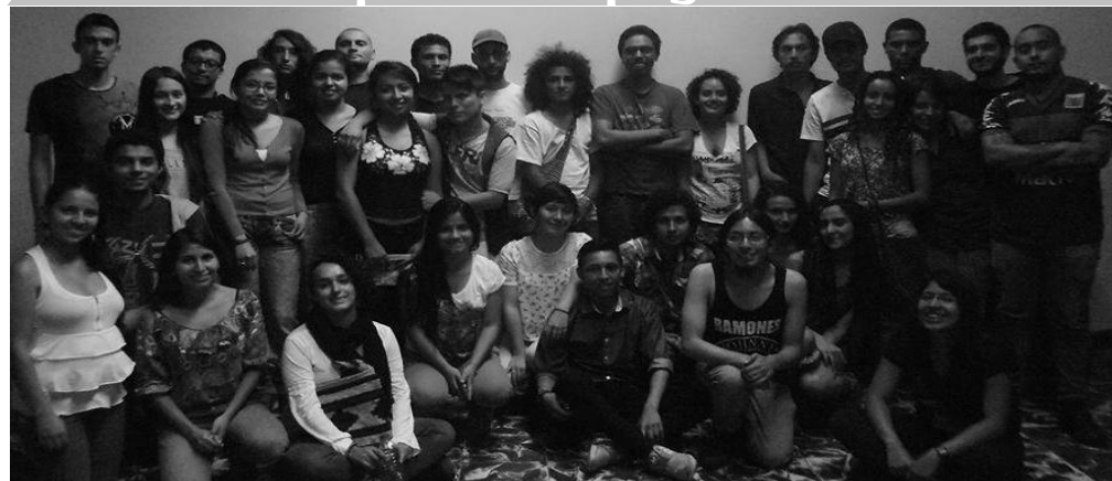
Pre-Encuentro Nacional de Pre Icfe y Pre Universitarios Populares - Popayán, 2015

Empieza un nuevo año y con él continúan nuestros deseos por construir lazos entre los diferentes procesos de educación popular a nivel local, nacional e internacional. Es por eso que, y siguiendo con las ediciones especiales, este número del Boletín Educándonos estará dedicado a una ciudad que nos ha dejado experiencias enriquecedoras: Popayán, capital del departamento del Cauca.